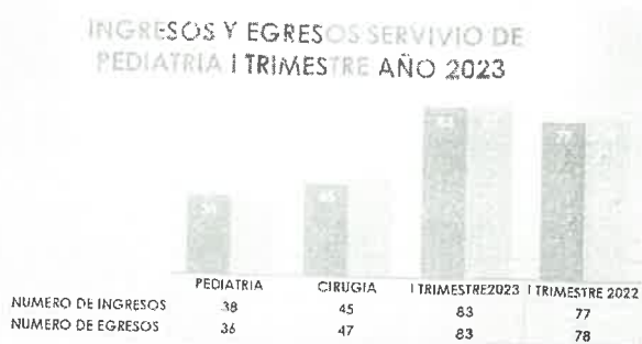
Indicadores II Trimestre 2023 – Servicio de Pediatría